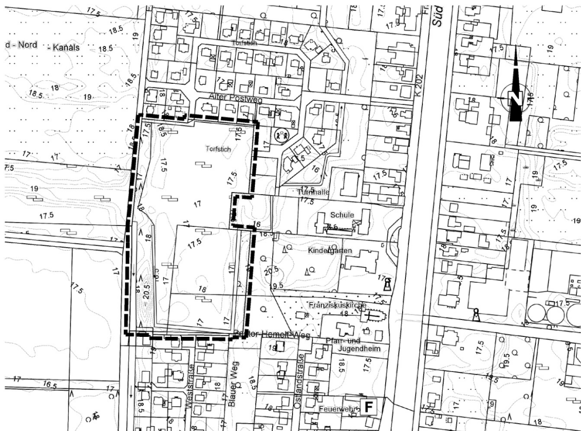
Übersichtsplan im Maßstab 1 : 5.000